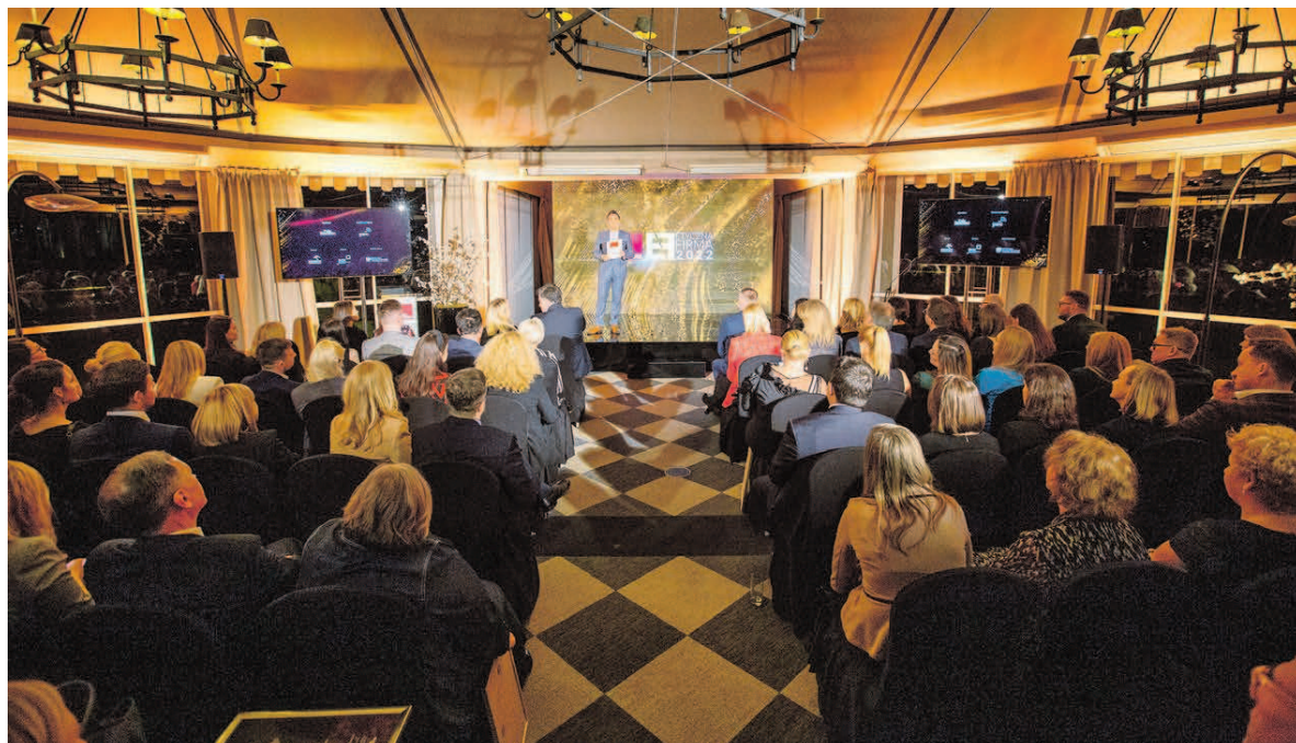
► BYLIŚCIE Z NAMI: Podczas gali konkursu Etyczna Firma nagrodziliśmy 25 najlepszych. Ale przedstawiciele odpowiedzialnego biznesu było z nami znacznie więcej. Zapraszamy was za rok.